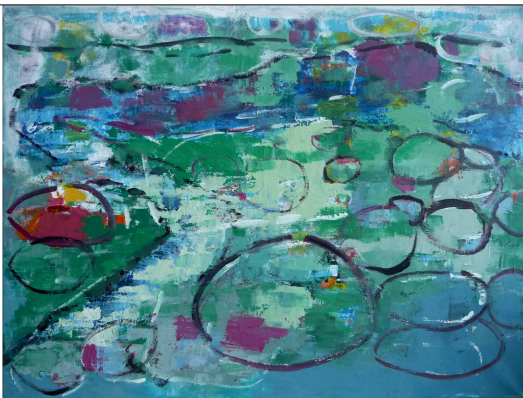
Waterworld (80x60 cm)