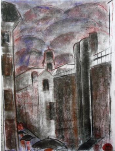
Skitse til CPH rain (A3 format)