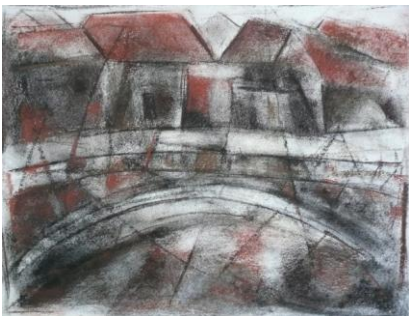
Skitse til NGOs at the Storm bridge (A3 format)