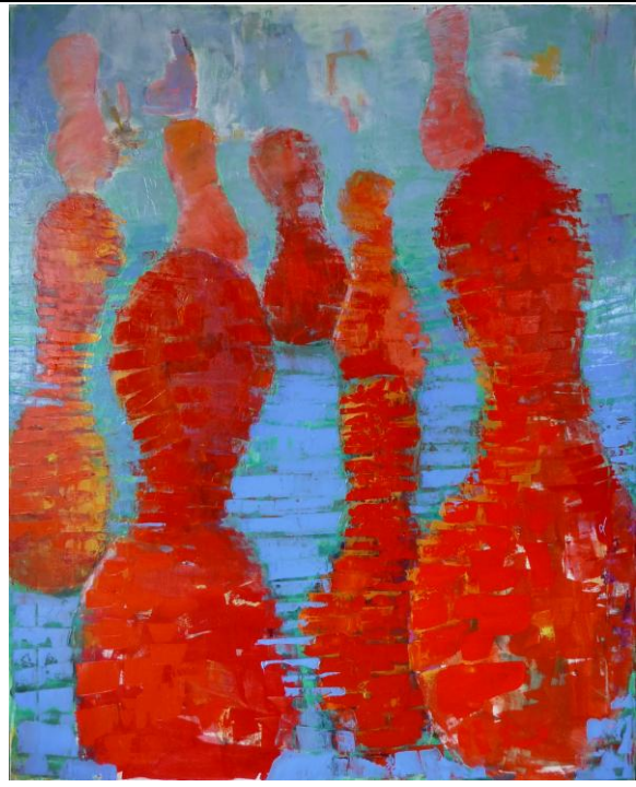
Organizations are bricks without mortar (80x100 cm)

Organisation- in-the-mind is what the individual perceives in his or her head of how activities and relations are organized, structured and connected internally. It is a model internal to oneself, part of one's inner world, relying upon the inner experiences of my interactions, relations and the activities I engage in, which gives rise to images, emotions, values, and responses in me, which may consequently be influencing my own management and leadership, positively or adversely... (Hutton, Balzagette and Read, 1997).