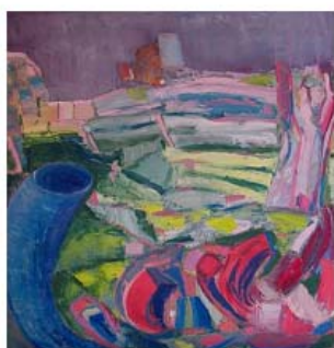
The passage of the marshes olie på lærred 50 x 50 cm

Jeg debuterede som kunstmaler i 2001 med serien: Geologisk arabesk inspireret af geologien og arabesken, et kurvet mønster bestående af kontinuerlige linjeforløb. Geologien er jo læren om Jorden, dens opbygning og udvikling, og herunder livets udvikling. Arabesken er ofte benyttet i billedkunsten til at udtrykke stiliserede planteornamenter, bladslyng, oftest symmetrisk opbygget, noget der kunne fortsætte i det uendelige. Arabesken er i øvrigt opkaldt efter arabiske ornamentter, idet den blev udviklet inden for den islamiske kunst. Senere blev den overtaget som udtryksform i andre kunstretninger. I musikken betegner arabesken en fantasifuld udsmykket melodi. De fleste af mine tidligere malerier er udført i aquaol, en vandbaseret oliemaling, koloristiske og lidt vilde.