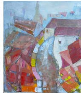
Indirect from my heart olie på lærred 80 x 100 cm