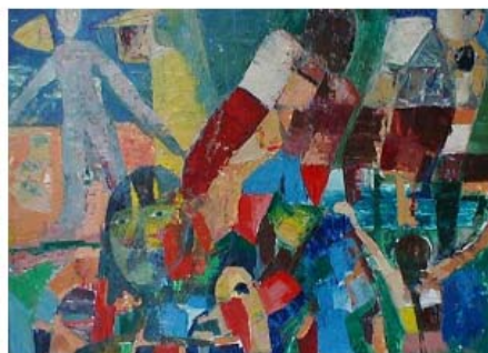
Populated algebra olie på lærred 100 x 80 cm

Eksempler på malerier fra serien Geologisk arabesk 2001