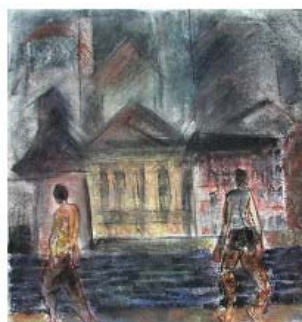
Downtown is growing farvepastel på papir 50 x 50 cm