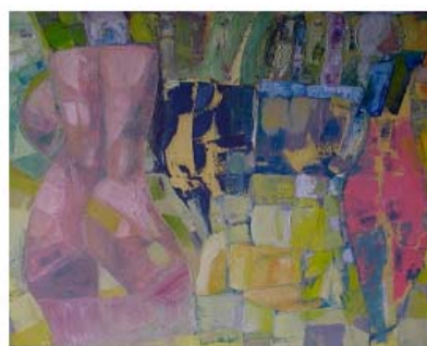
Hope olie på lærred 115 x 90 cm

Eksempler på malerier fra serien New York cool! 2001