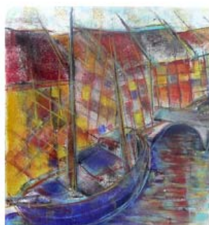
Blue ship in old harbour farvepastel på papir 50 x 50 cm

De værker jeg udstiller i Ringsted kongrescenter repræsenterer tre kapitler af mit kunstmaler liv , samtidig med at det er første gang, jeg udstiller et udvalg og en samling malerier fra ovenstående tre serier. Jeg har valgt titlen: " Zoneringsmalerier fra Øresundsregionen ", fordi det under et besøg på Phoenix art museum i USA i august gik op for mig, at den kunstneriske udvikling jeg havde fulgt, måske var en parallel proces til Bay Area Figurative Movement , som med afsæt i abstrakt-ekspressionistisk maleri (fra New York School) bevægede sig i en mere figurativ retning, bl.a. anført af kunstnere som Richard Diebenkorn, Paul Wonner m.fl. Rent faktisk slog det mig, at nogle af mine bylandskabsmalerier havde en del lighedspunkter med West Coast retningen centreret omkring kunstmiljøet i San Francisco i Californien. Når det abstrakt-ekspressionistiske integreres i det figurative, så har vi et zoneringsmaleri 1 , skabt i en adaptiv og integrerende proces.