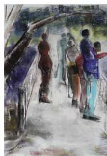
Bothanical garden farvepastel på papir 30 x 40 cm