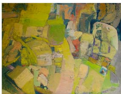
Green Day olie på lærred 80 x 65 cm