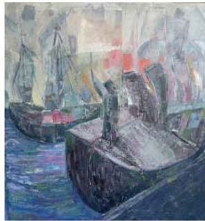
Boggy ground olie på lærred 100 x 100 cm