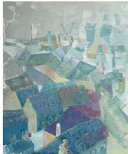
Blue green roof mosaic olie på lærred 80 x 100 cm