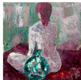
Woman with jar olie på karton 50 x 50 cm