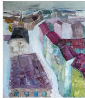
Psychodynamic spring olie på lærred 80 x 100 cm