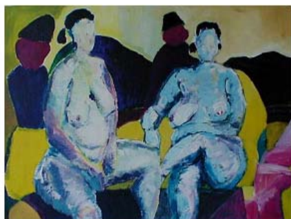
Shadows on the wall akryl på lærred 40 x 71 cm

Jeg er civilingeniør fra Danmarks Tekniske Universitet 1982 og har siden 1994 været ansat hos Danmarks og Grønlands Geologiske Undersøgelse (GEUS), hvor jeg til dagligt arbejder med modellering af vandets kredsløb, klimændringer og adaptiv og integreret vandressource forvaltning. Jeg har desuden en mastergrad i organisationspsykologi fra RUC fra 2005.