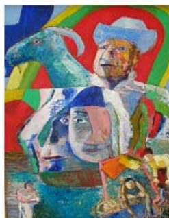
Flooding and wayne olie på lærred 55 x 77 cm